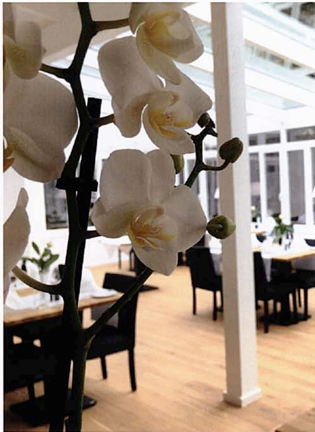
Blick in unseren Wintergarten

Wir bieten Ihnen den idealen Rahmen um in privater und individueller Atmosphäre feiern zu können. Unser Haus steht Ihnen ab ca. 40 Personen exklusiv zur Verfügung und Sie können mit bis zu ca. 65 Personen feiern. Wir sind wandelbar und stellen Ihnen neben unserem Gastraum auch gerne unseren Garten, die Terrasse und unsere Kochschule zur Verfügung um Ihnen einen unvergesslichen Tag in unserem Haus zu bereiten. Über Hochzeit mit freier Trauung, Geburtstags- oder Firmenfeier. Wir finden eine passende Lösung für Sie.