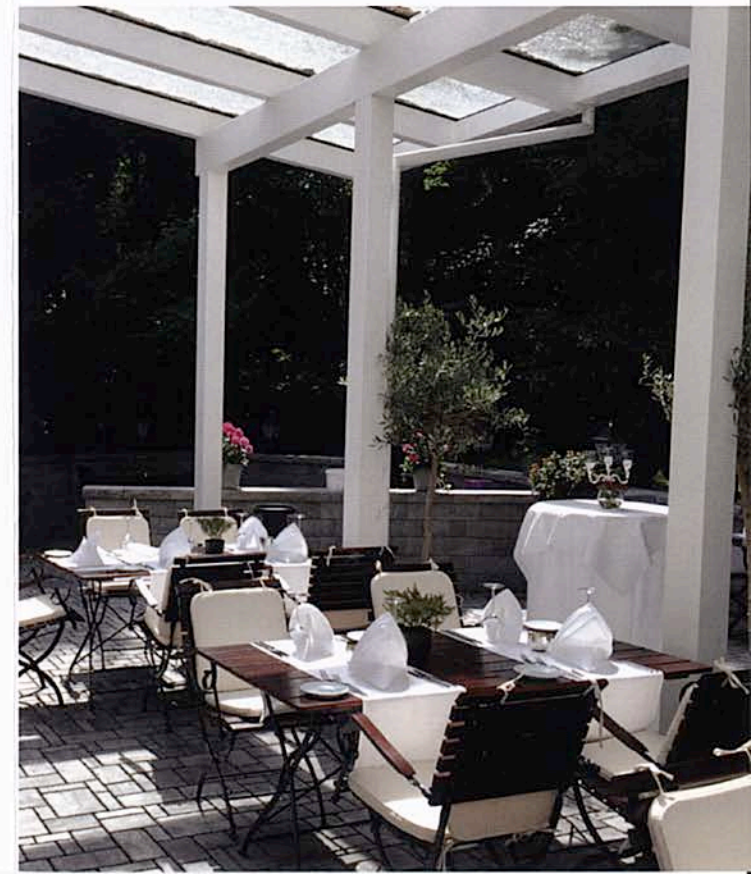
Terrasse mit Blick in den Garten

Nicht nur im Sommer bietet unsere teils überdachte Terrasse ein schönes Ambiente nicht nur zum speisen. Mit direktem Zugang zum großen Garten bietet Sie den idealen Rahmen für Sommerfeste, Hochzeiten oder eine schöne Feier in unserem Haus.