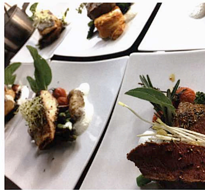
Unser Lammrücken und Lachs auf Gemüse und Süßkartoffelgratin